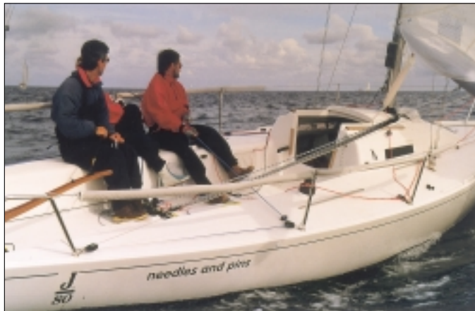
J 80, ein auch mit kleiner Crew einfach zu segelndes Regatta-boat.

wir bei der J 80 fast gescheitert. „Glücklicherweise“ fanden wir in der Decksschale doch einen Formfehler. Hier ist beim Spachteln und Schleifen des Endfinish der Form etwas Zeit gespart worden. Eine etwas „grisselige Kante“ ist das Ergebnis. Trotz weiterer Suche konnten wir nichts finden.